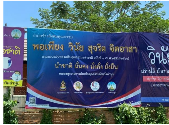
ป้ายประชาสัมพันธ์การปฏิบัติตามหลักธรรมพอเพียง วินัย สุจริต จิตอาสา