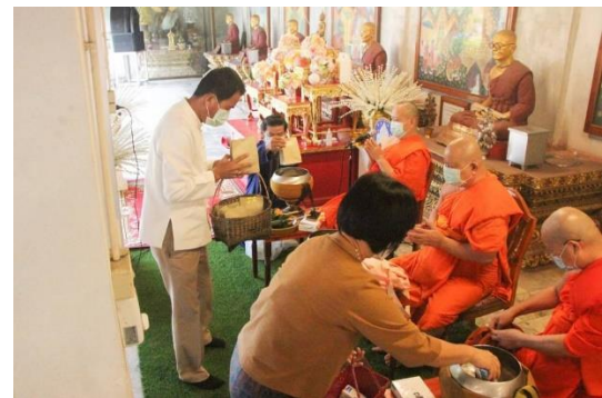
การส่งเสริมบุคลากรเจ้าหน้าที่ปฏิบัติตามหลักธรรมทางศาสนา