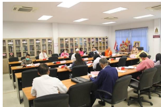
การประชุมคณะกรรมการส่งเสริมคุณธรรมจังหวัดลำพูน ครั้งที่ ๑/๒๕๖๔