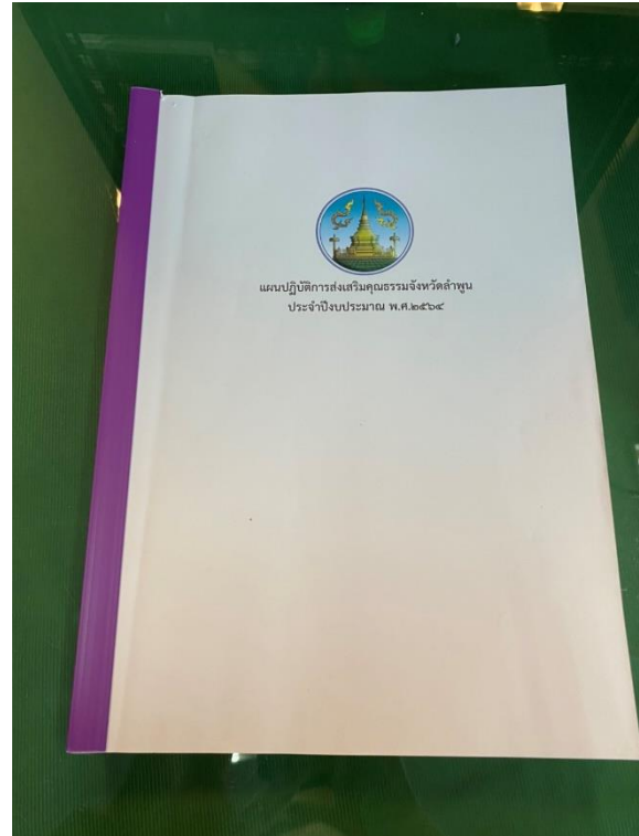
แผนแม่บทส่งเสริมคุณธรรมจังหวัดลำพูน และแผนปฏิบัติการส่งเสริมคุณธรรมจังหวัดลำพูน