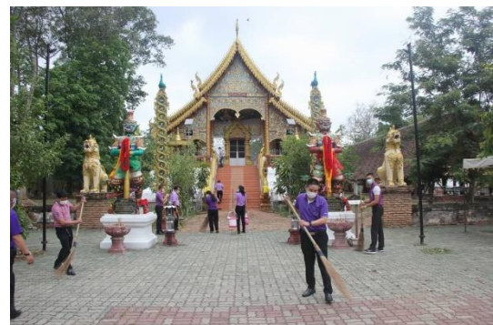
กิจกรรมจิตอาสาบำเพ็ญประโยชน์ในพื้นที่จังหวัดลำพูน