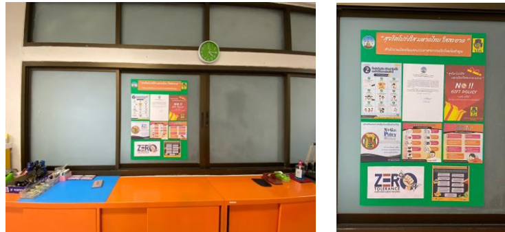
ภาพที่ ๑-๒ : จัดทำบอร์ดประชาสัมพันธ์เผยแพร่ข้อมูลข่าวสาร ความรู้เกี่ยวกับการป้องกันปราบปรามการทุจริตและประพฤติมิชอบ เพื่อรณรงค์สร้างจิตสำนึกความซื่อสัตย์ สุจริต ปลูกฝังทัศนคติ วัฒนธรรมอันดี ในการต่อต้านการทุจริตให้แก่บุคลากรในสำนักงานฯ