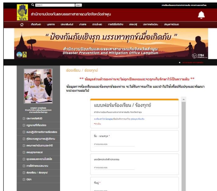
ภาพที่ ๓ : จัดทำระบบการรับเรื่องร้องเรียนของหน่วยงานผ่านเว็บไซต์ของหน่วยงาน