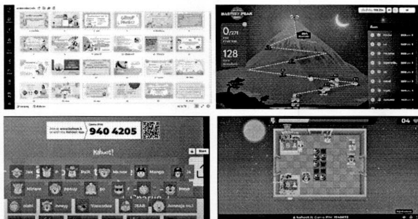
ภาพที่ 2 MINI JAM SMART COMMUNITY : ทบทวนเนื้อหาการเรียนรู้

การใช้รูปภาพเป็นไปตามข้อกำหนดตามพระราชบัญญัติคุ้มครองข้อมูลส่วนบุคคล พ.ศ. 2562