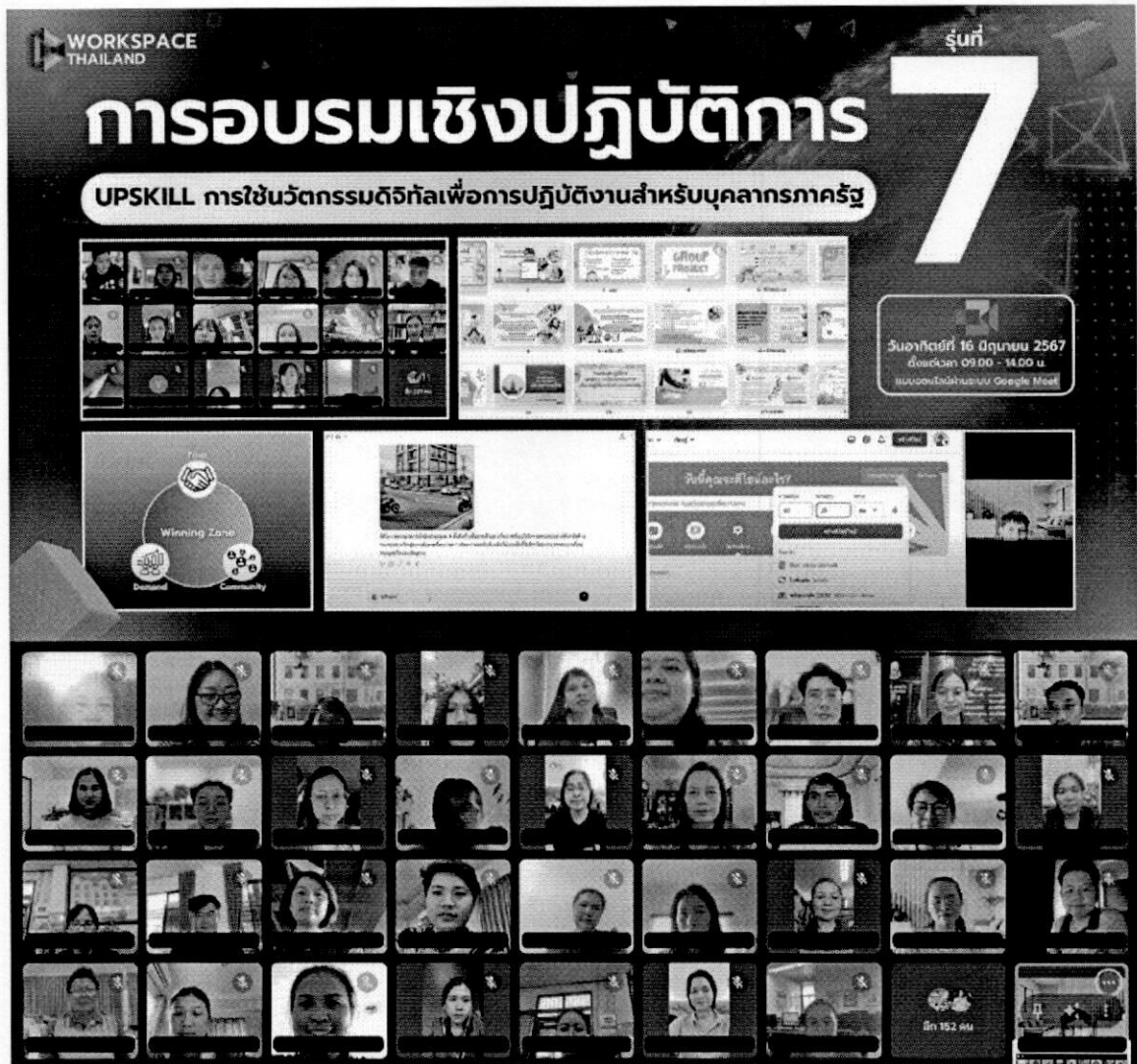
ภาพที่ 1 การอบรมที่ผ่านมาจัดโดยเวิร์คสเปซ ไทยแลนด์

ภาพถ่ายการอบรมที่ผ่านมาจัดโดยเวิร์คสเปซ ไทยแลนด์