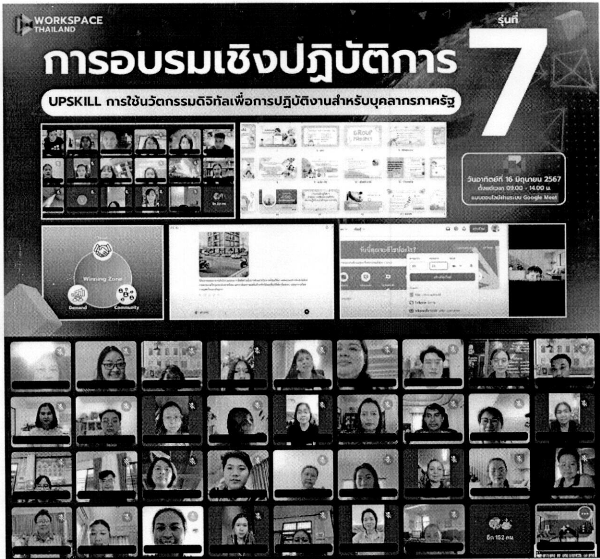
ภาพที่ 1 การอบรมที่ผ่านมามาจัดโดยเวิร์คสเปซ ไทยแลนด์

ภาพถ่ายการอบรมที่ผ่านมามาจัดโดยเวิร์คสเปซ ไทยแลนด์