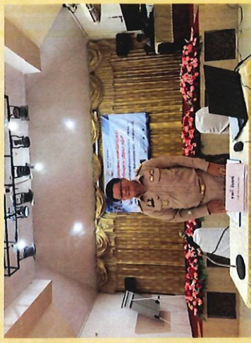
รูปแบบการพัฒนาโครงการ (สัมมนา ครั้งที่ 2) ณ ห้องประชุมเทพประทาน เอี่ยมศาลา รีสอร์ท ตำบลป่าสัก อำเภอเมืองลำพูน จังหวัดลำพูน